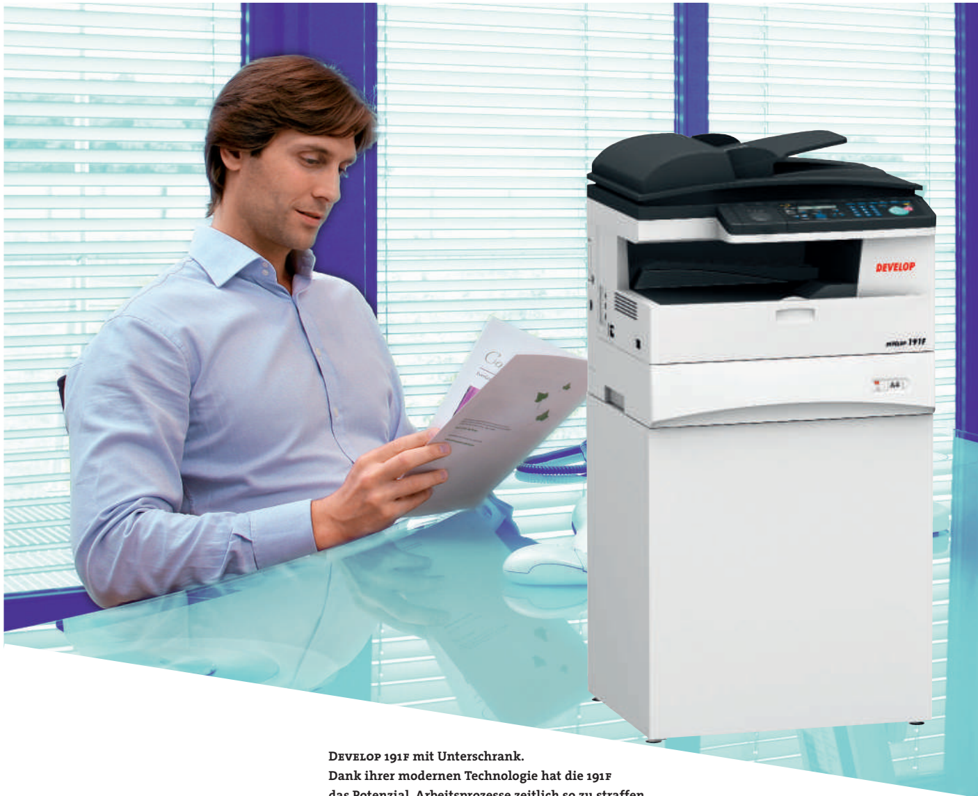
DEVELOP 191F mit Unterschrank. Dank ihrer modernen Technologie hat die 191F das Potenzial, Arbeitsprozesse zeitlich so zu straffen, dass Kosten spürbar gesenkt werden.